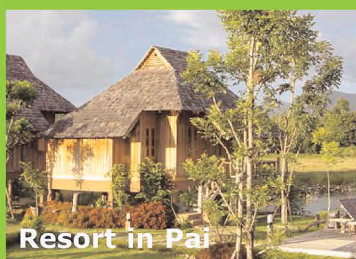
Resort in Pai